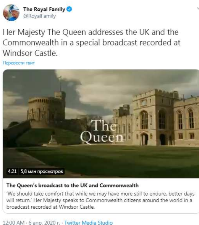
Рис. 1. Официальный Twitter Королевской семьи (The Royal Family). Перевод: «Ее Величество Королева обращается к Великобритании и Содружеству в специальной передаче, записанной в Виндзорском замке».

Видеообращение, записанное в Виндзорском замке, было направлено в BBC, но более широкое распространение оно получило в социальных сетях королевской семьи, благодаря чему получило отклик далеко за пределами Соединенного Королевства. Может быть, Королева и обращалась к своим соотечественникам, но за ней определенно наблюдал весь мир [3].