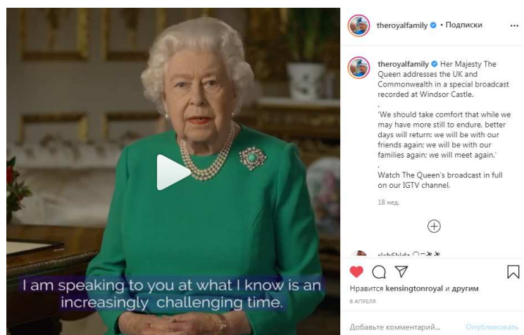
Рис. 3. Официальный Instagram Королевской семьи. Обращение Королевы и благодарность медицинским работникам.

6 апреля было продублировано обращение правящего монарха и опубликовано аккаунтами Королевской семьи в социальных сетях.