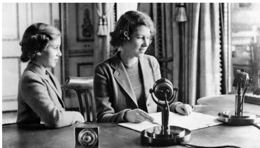
Рис. 2. Первая радиопередача Королевы Елизаветы II в 1940 году, когда она и ее сестра Принцесса Маргарет разговаривали с эвакуированными детьми.

Причиной такой бурной реакции и составлением теорий послужило единственное прямое упоминание Королевой о ее первой радиопередаче в 1940 году, когда она – еще юная Принцесса – и ее сестра Маргарет общались с эвакуированными детьми. 94-летняя Королева сказала, что «болезненное чувство разлуки со своими близкими», вызванное у людей социальной дистанцированностью, напомнило ей об эвакуированных детях, которых ей довелось увидеть во время Второй мировой войны. Это было напоминание не только о невинности детства и жертвах предыдущего поколения, но и об ее долгом знакомстве с британской историей и историей всего мира. Об ее богатом жизненном опыте, как простого гражданина, так и монарха.