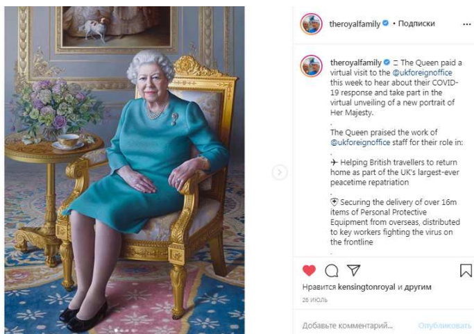
Рис. 6. Официальный Instagram Королевской семьи. Отчет о встрече с сотрудниками Форин-офиса.