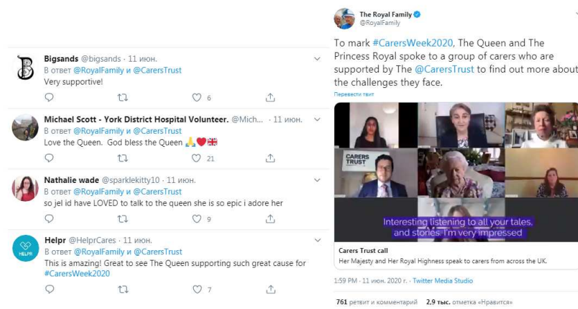
Рис. 8. Официальный Twitter Королевской семьи (The Royal Family) и комментарии пользователей.

ся с пандемией. Об этом можно судить по количеству положительных откликов в комментариях под постами с деятельностью Королевы и Королевской семьи [7]: «Активно поддерживаю!»; «Люблю Королеву. Боже, храни Королеву»; «Завидую, мне ПОНРАВИЛСЯ разговор с Королевой, она такая эпичная, я ее обожаю»; «Это потрясающе! Здорово видеть, что Королева поддерживает #CarersWeek2020».