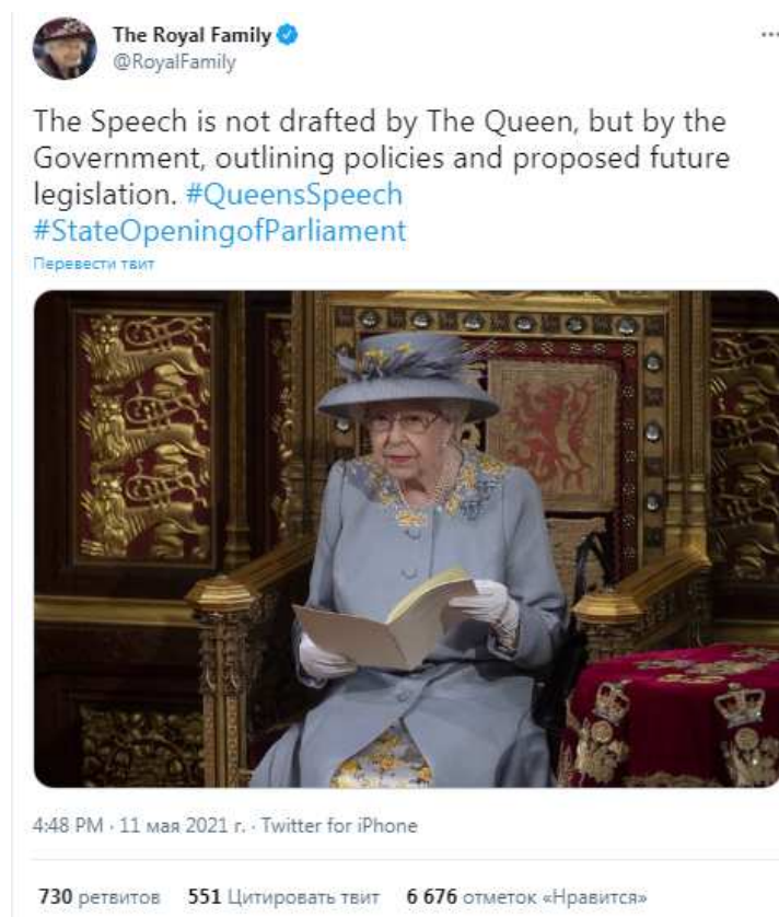
Рис. 1. Официальный Twitter Королевской семьи (The Royal Family).

сказано следующее: «Речь подготовлена не королевой, а правительством, в ней излагается политика и предлагаемое будущее законодательство» (см. Рис. 1.).