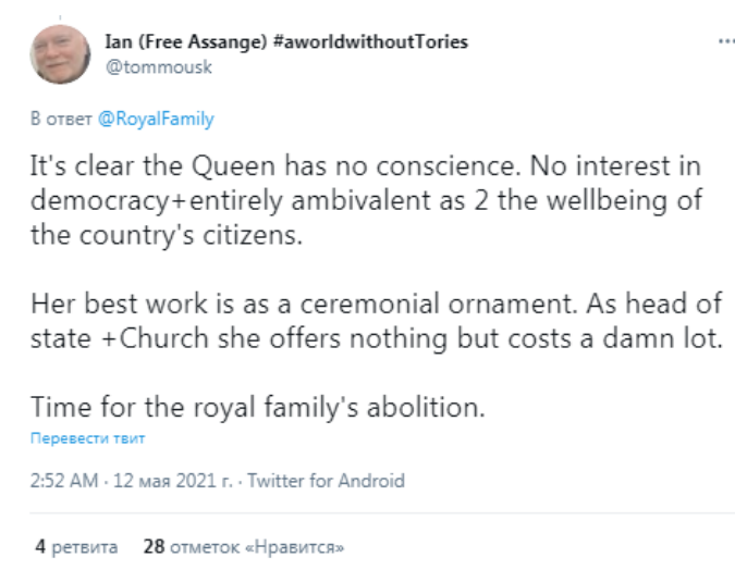
Рис. 4. Твитт пользователя @tommousk.

Другие пользователи выражают свое беспокойство и негодование действиями королевы: «Хотя это противоречит протоколу, разве королева не может наложить вето на плохое, авторитарное правление, чтобы защитить британский народ?» – пишет пользователь @GavGreer [9]. Пользователь @AnnCore16 добавляет: «Мне очень жаль, но, учитывая поляризацию страны, неправильно, что королева сообщает о том, что тори приготовили для нас» [10].