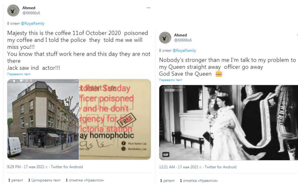
Рис. 5. Твитт пользователя @66666s6.

Помимо негативных, нейтральных и положительных комментариев встречаются и «странные», не относящиеся к теме поста. К примеру, под новостной «веткой» официального аккаунта @RoyalFamily, в котором рассказывается о «Зеленом Своде Королевы»: «Сегодня отмечается запуск @qgsaпору, уникальной инициативы по посадке деревьев в Великобритании, созданной в ознаменование Платинового юбилея королевы в 2022 году», можно встретить множество комментариев пользователя @66666s6. Из-за манеры написания, содержания и промежутка между публикациями, сообщения пользователя вызывают чувство тревоги, лишь от одного только присутствия в данном разделе: «Величество, в этом кафе 11 октября 2020 года отравили мой кофе, и я сообщил полиции, но они сказали мне, что мы будем скучать по тебе!!!» [15]. Следует отметить, что сообщения написаны с ошибками и опечатками, содержат много изобразжений и эмоджи: «Нет никого сильнее меня. Я поговорю о своей проблеме с моей Королевой, офицер, немедленно уходи. Боже, храни королеву» [16] (см. Рис. 5.).