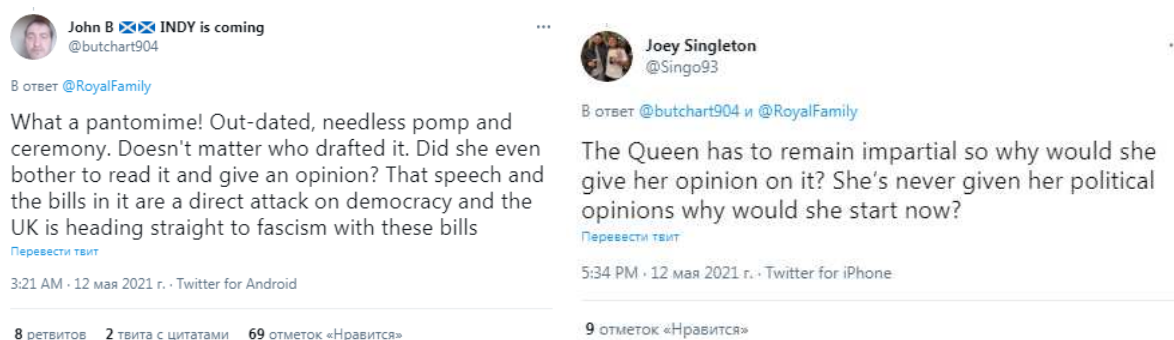
Рис. 2. Твитты пользователей @butchart904 и @Singo93.

Продолжая анализ данного блока сообщений, мы нашли комментарий пользователя @reece180367: «Да, сообщение не составлено королевой, однако она может высказывать возражения, но из-за этого она и ее паршивая семья могут лишиться комфортной жизни, которую они, по их мнению, заслуживают» [6]. В данном комментарии мы видим ярко выраженную критическую окраску, переходящую в оскорбление не только королевы, но и ее семьи. Подобную тенденцию поддерживает и пользователь @JH_Campbell, который подобрал для своего комментария довольно грубые выражения [7]: «Она могла бы уйти на пенсию, чтобы ее престарелый сын, чей единственный навык главы государства состоит в том, чтобы первым выскочить из правильного влагища, смог стать королем... или мы просто откажемся от всех королевских «обязанностей» (см. Рис. 3).